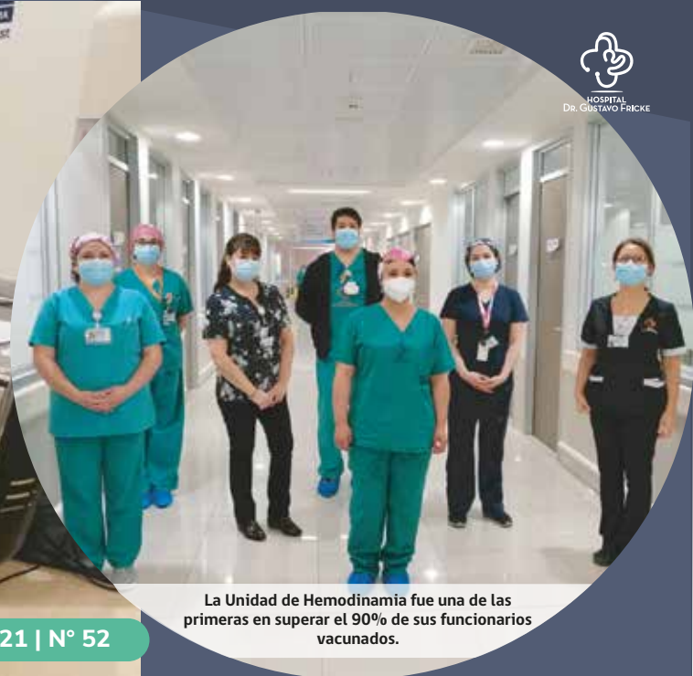
La Unidad de Hemodinamia fue una de las primeras en superar el 90% de sus funcionarios vacunados.